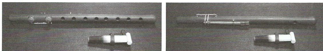
Duduk à clefs

Ce duduk est construit à partir du duduk en la -(Do). Le trou inférieur de la face arrière est percé sur la face avant, puis bouché par une clef. Le tuyau plus long permet la perce d'un trou supplémentaire bouché par une seconde clef. Les deux clefs sont mues par le pouce droit.