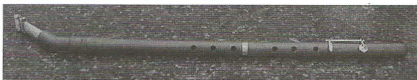
Duduk basse